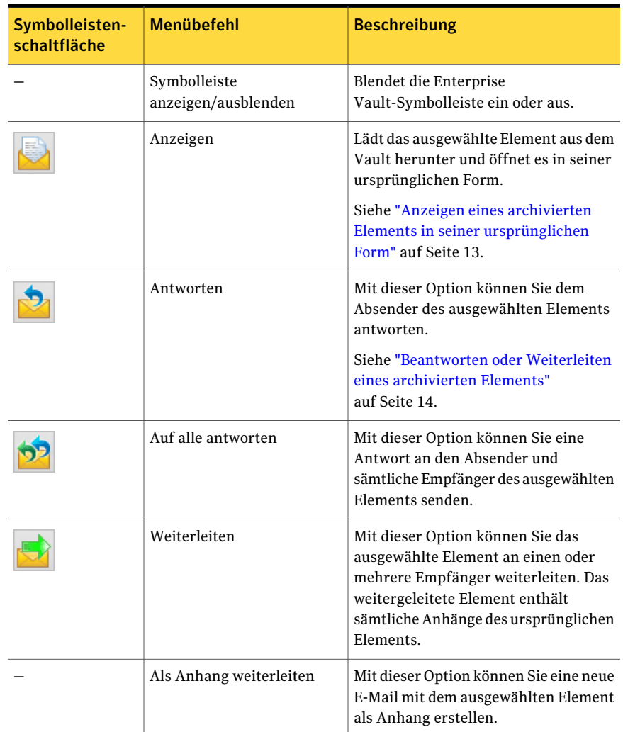
Tabelle 1-1 Enterprise Vault-Symbolleistenschaltflächen und -Menübefehle

Die folgenden Schaltflächen können auf der Enterprise Vault-Symbolleiste verfügbar sein, abhängig davon, wie Ihr Administrator Enterprise Vault eingerichtet hat. Ähnliche Funktionen sind möglicherweise auch über das Menü der Enterprise Vault-Client-Anwendung verfügbar.